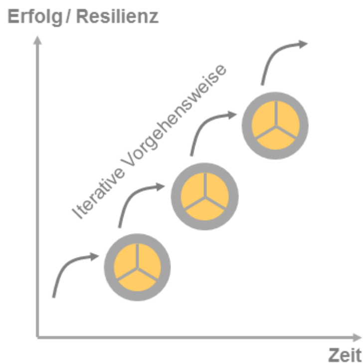
Iterative Resilienz-Schleife

Dadurch können bereits in der ersten Sitzung hilfreiche Maßnahmen erarbeitet und umgesetzt werden. In jeder weiteren Coaching-Sitzung werden die Wirkungen dieser Maßnahmen anhand des Modells geprüft, Ziele justiert und ergänzende Aktivitäten erarbeitet. Diese Vorgehensweise bezeichnen wir als Iterative Resilienz-Schleife: